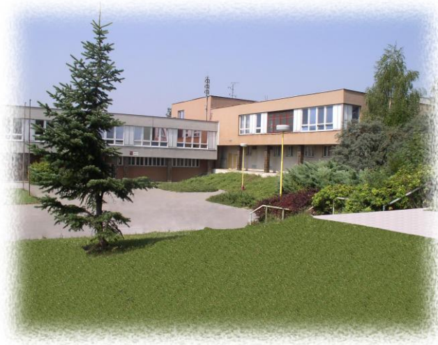
Pracoviště Dlouhá 56