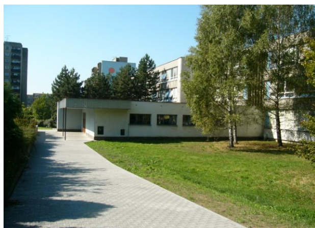
Pracoviště Jubilejní 3