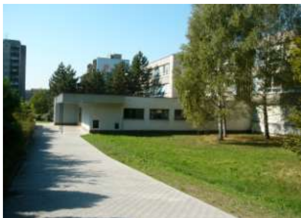
Pracoviště Jubilejní 3