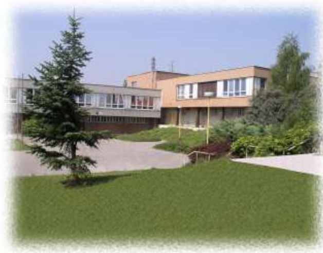
Pracoviště Dlouhá 56